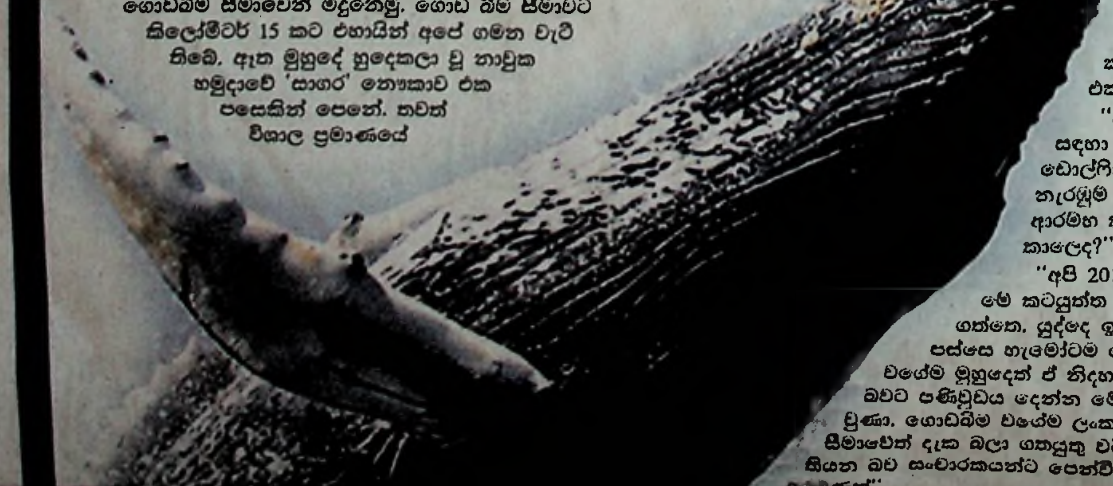
සටහන හා ඡායාරූප : අසිංක ආචාර්‍ය

ගැසුනෙමු. පුත්ස් මර් ලංකා නැව් හසුරුවමින් ඔබුණු අප හා මිත්‍රශීලී කනාවට එකතු වූහ. "සංචාරකයන් සඳහා තල්මසුන් හා වොල්පින් මසුන් නැරඹුම් කටයුතු ආරම්භ කළේ කොයි කාලයද?" "අපි 2011 දී තමයි මේ කටයුත්ත පටන් ගත්තෙ. යුද්දේ ඉවර වුණොට පස්පහ හැමෝටම ගොඩබිම වශේම මුහුදෙන් ඒ නිදහස තියන බවට පණිවුඩය දෙන්න මෙක හේතු වුණා. ගොඩබිම වශේම ලංකා මුහුදු සීමාවෙන් දැක බලා ගතයුතු වටිනා දේ සියන බව සංචාරකයන්ට පෙන්වීම මෙක අරමුණක්".