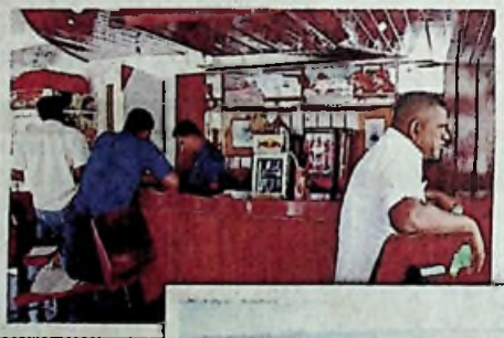
උත්සාහයක් දරනු පෙනේ.