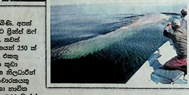
15 ක් පමණ ගියපසු ඇත දියගෙහි. මේ වැනි තල්මසුන් 12 ක් පමණ තැනින් තැන අපට දැකිය හැකි විය.

ශ්‍රී ලංකා නාවික හමුදාව මේ සුන්දර අත්දැකීම ඔබට එකතු කරන්නට මග බලා සිටී. ඔය කියන තරම් අපේ මුහුදේ තල්මසුන් වොල්පින් සිටීද? විවේක ඔබ පමණක් නොව අපටද එය කුහුලක් විය. එය ඇත්තටම බලා ඔබට ලියන්නට පසුගියදා අපින් ඒ සංචාරයට ගියෙමු. කොළඹ නුරුගිටිය ගංගාරාමාධිපති ගල්බොඩ ශ්‍රී ඤාණස්සර හිමි, එම විහාරාධිකාරී ආචාර්ය කීර්තී අස්සේ හිමි, පාලුවේ ජනරතන හිමි, ආචාර්ය පල්ලේගම රතනසාර හිමි සමග පසුගියදා අපින් ගාල්ල වරායට ගියෙමු. එහිදී අපට ඉතා සුඛදායී ලීඩ් පිළිගත්තේ ගාලු වරාය නාවික කදවුරේ සේනාධි නිලධාරී පිරිසකි. ගාලු වරායේ දැවැන්ත නැව් කිපයක්ද වෝරා යාත්‍රා සහ තවත් කුඩා යාත්‍රා රාශියක්ද ස්ථානගත කර තිබිණි. අපත් සමග සයුර බලා ඇදෙන්නට පුත්ස් මර් ලංකා නැව් සුදානම් වී සිටී. තවත් දේශීය හා විදේශීය සංචාරකයන් 250 ක් පමණ අප සමග ඒ ගමනට එකතු වෙයි. ඉතා සුවපහසු ආසන කුඩා වෙලෙඳසල් සුඛදායී නාවික නිලධාරීන් සංග්‍රහ ශීලී සේවය සෑම සංචාරකයකු විෂයෙහිම ලබාදීමට ශ්‍රී ලංකා නාවික හමුදාව කැපවී සිටී. උදෑසන 7.00 පුත්ස් මර් ලංකා නැව් මුහුදට ඇදෙන්නට විය. ඇතට යන තුරුම ගාල්ලේ සුන්දරත්වය අපි මුහුදේ සිට විඳ ගනිමු. මුහුදු රළට යන්නම් පැද්දෙන නැවේ නැරඹුම් ස්ථාන වෙත සියලු සංචාරකයෝ ඇදෙන්නට වූහ. මුහුදු සුළඟ කපාගෙන ඉදිරියට ඇදෙන නැවේ සිට බලන විට කලීන්ද රාත්‍රියේ මුහුදු ගිය ධීවර යාත්‍රා ගොඩ බිමට ඇදෙනු පෙනේ. අපි ක්‍රමයෙන් ගැඹුරු මුහුදු කරා ගොඩබිම සීමාවෙන් මිදුනෙමු. ගොඩ බිම සීමාවට කිලෝමීටර් 15 කට එහායින් අපේ ගමන වැටී තිබේ. ඇත මුහුදේ හුදෙකලා වූ නාවුක හමුදාවේ 'සාගර' නොකොට එක පසෙකින් පෙනේ. තවත් විශාල ප්‍රමාණයේ