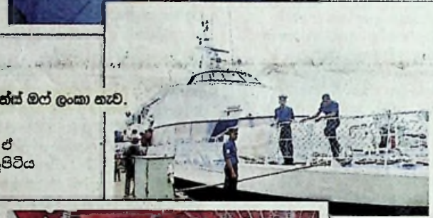
පුත්ස් මර් ලංකා නැව්.